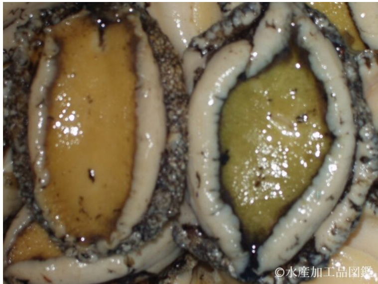
写真1 貝肉の色の違い（左：正常 右：青貝）