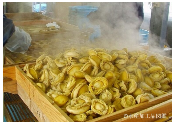
写真7 放冷