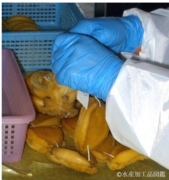
写真9 乾燥（糸通し）