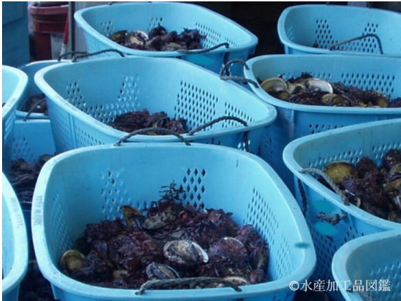
写真2 原料