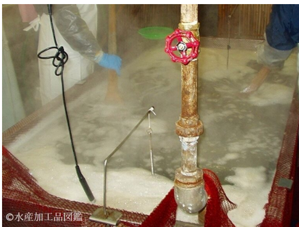
写真6 煮熟