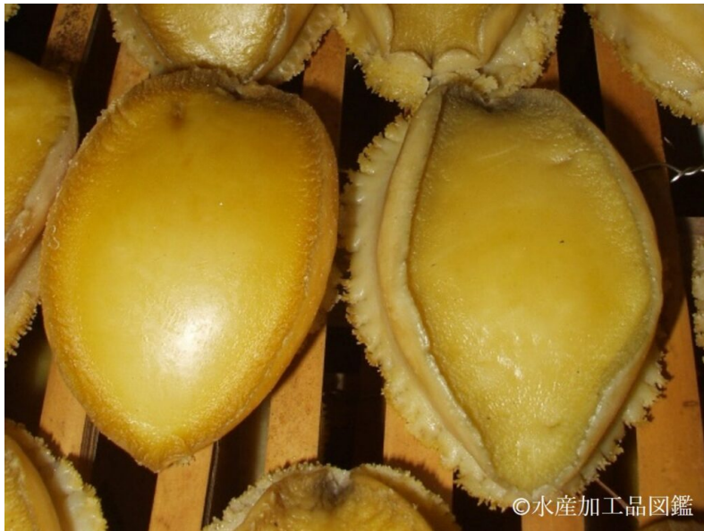
写真12 干しあわび良品 (左)