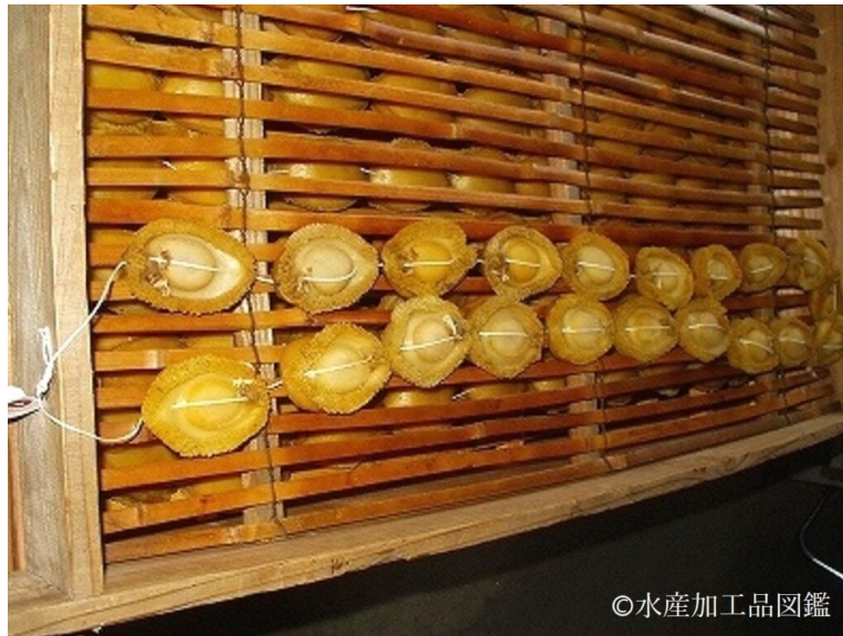
写真11 乾燥（あんじょう）