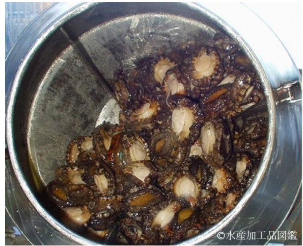
写真5 洗浄