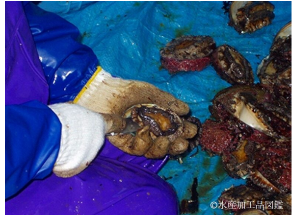
写真3 脱殻