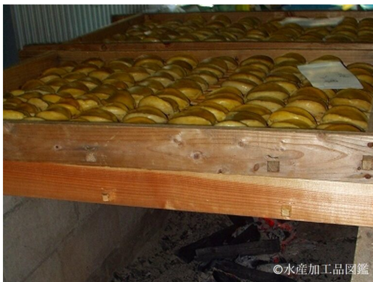
写真8 焙乾