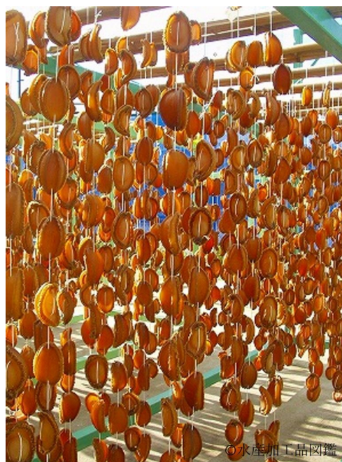
写真10 乾燥（風乾）