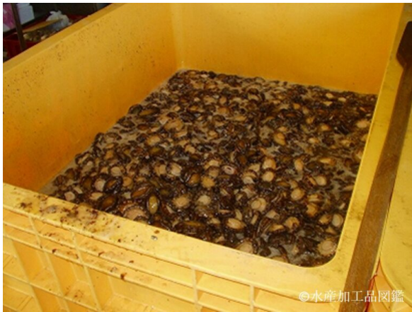
写真4 塩漬け