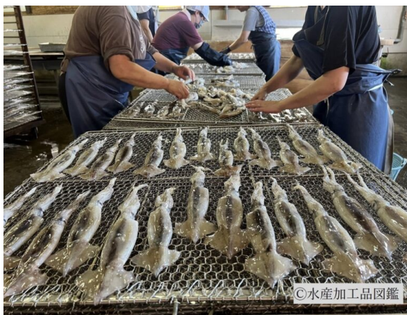
写真1 塩漬けたイカを並べて干す様子