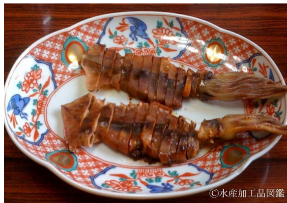
写真3 いか丸干し製品