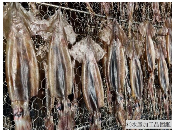
写真2 乾燥したいか丸干し