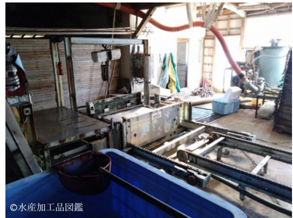
写真2 コンベヤ及びせいろを積み重ねる装置