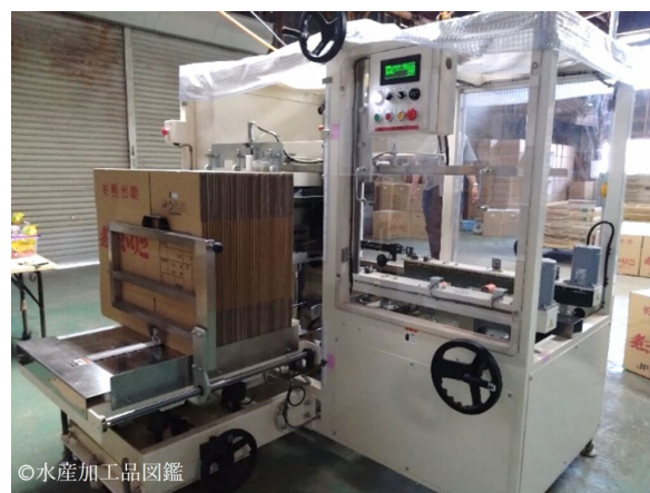
写真7 製函機