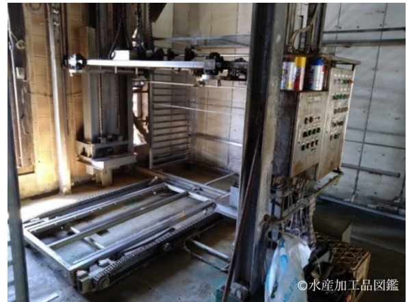
写真4 差し機と乾燥台車 (提供：長崎県総合水産試験場)