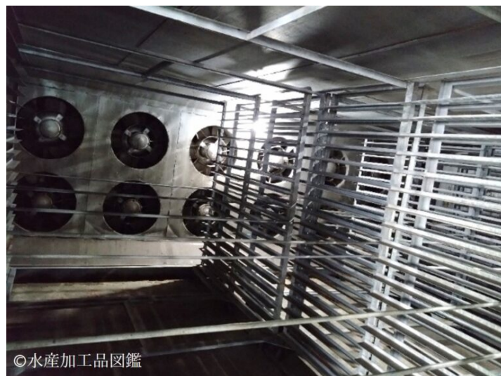
写真5 乾燥室内の様子