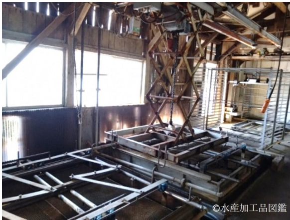
写真3 2基の煮釜とホイストクレーン