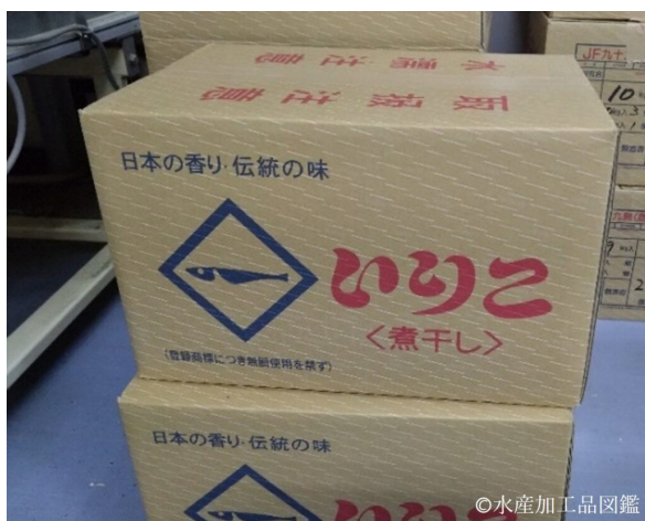
写真6 出荷用段ボール箱