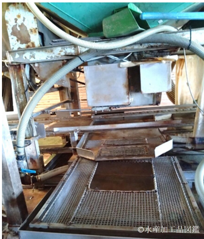
写真1 オートフィーダー