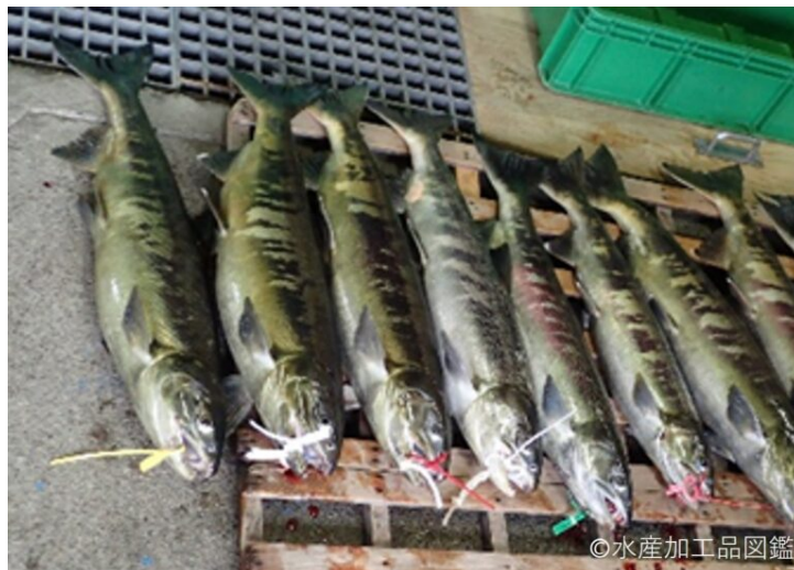
写真1 原料のブナザケ

(本文末尾のコラム「魚醤油の風味改良 一麴を使用した魚醤油製造技術の実用化―」もご参照ください。)