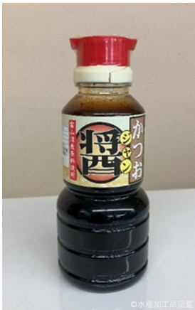
写真3 ソウダガツオ魚醤油

現在、ぶなざけ魚醤油は、原料不足等の影響により生産量は減少している。しかし、ぶなざけ魚醤油の加工技術は、ソウダガツオ等の低利用魚、規格外のニギス、富山県の特産魚であるブリの未利用部位（内臓）やホタルイカを原料とした様々な魚醤油の開発に応用されており、新規製品（写真3～6）が富山県内数社から国内外において上市されている。