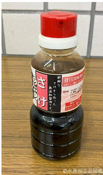
写真2 ぶなざけ魚醤油