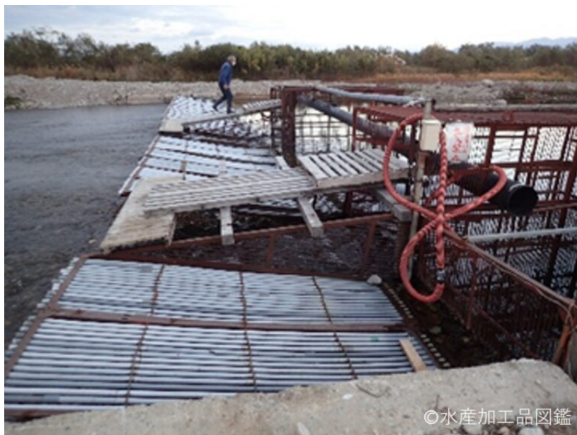
写真7 川に遡上するサケ捕獲用の築（やな）

そこで富山県食品研究所では、平成8年度から、ぶなざけ魚醤油の開発に取り組み始めた。日本の三大魚醤油（いしり、しょつつる、いかなご魚醤油）は魚肉の自己消化酵素による自然発酵が主体であるが、ぶなざけ魚醤油は、副原料に醤油麴を使用することで、発酵・熟成の促進や魚醤油特有の不快臭の抑制に成功した。開発当時、実用レベルで醤油麴を使用した魚醤油の製造は国内初であった。