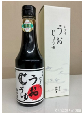
写真4 にぎすうおじょうゆ