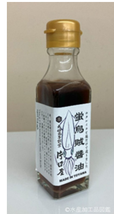
写真6 ホタルイカを原料とした 蛸烏賊醤油