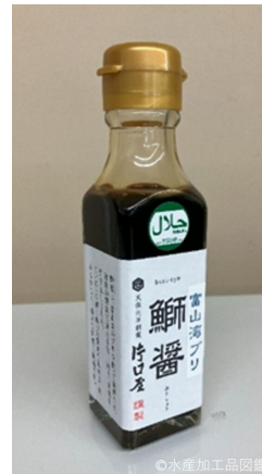
写真5 ブリ内臓を原料とした 鰯醬